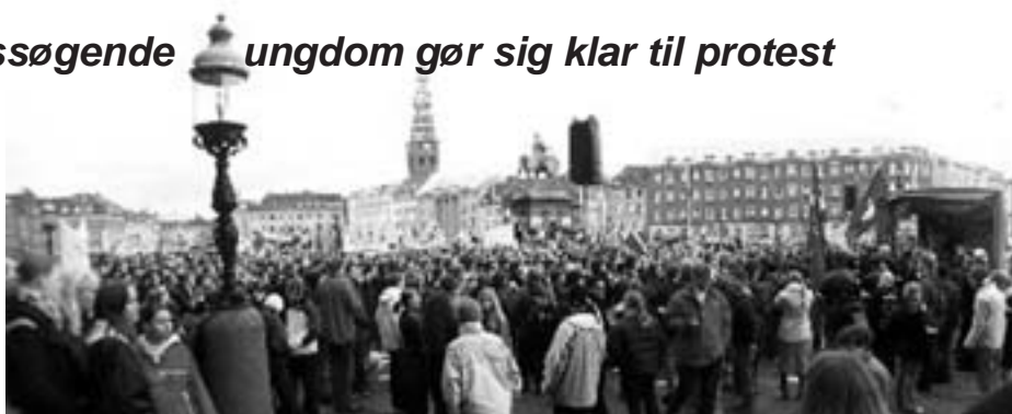
Tidligere protester: Elevdemo ved Christiansborg 7.02.2002

STOP NU-initiativet er en bred sammenslutning af elever og studerende. Initiativet har samlet en mængde organisationer og netværk, hvis mål er at samle ungdommen om fælles krav til bedre uddannelse. På konferencen d. 22. september vil græsrodder fra hele landet