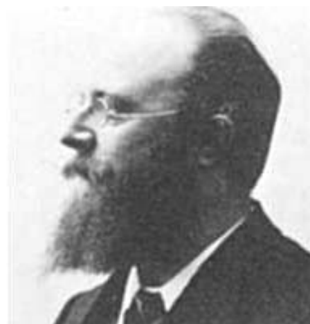
Thorvald Stauning - dansk højresocialdemokrat - fulgte trop i forræderiet mod socialismen

tive eksempel fik betydning for millioner af mennesker i mange år derefter.