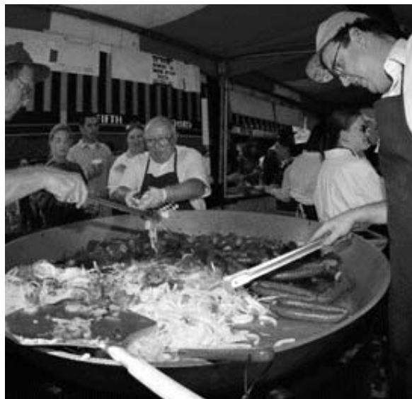
Forbrugsfesten er forbi - før den kom i gang

Den dystre udvikling blev også bekræftet på en konference, som Dansk Arbejdsgiverforening (DA) havde indkaldt. Debatten handlede om 'velfærd', og deltagerne bestod af eksperter og politikere fra blandt andet Velfærdskommissionen og Arbejderbevægelsens Erhvervsråd, som hurtigt kunne blive enige om, at globaliseringen med den voldsomme lønforskel mellem Danmark og specielt Østasien udgør en