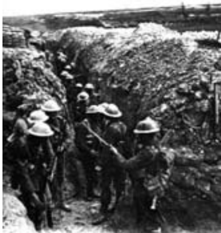
Første Verdenskrig - et imperialistisk slagtehus med "demokratiske socialisters" velsignelse

Det var 'ikke for at fremkalde nogen større offentlig demonstration fra det internationale proletariats side. Dette er tiden ganske sikkert ikke til ... men for at sige, at partifællerne i alle lande til det sidste bestræbte sig for at afværge krigen. Heri ligger også et løfte om, at det, når krigen engang er endt, vil være muligt ... atter at samles til enigt