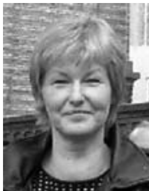
Af Dorte Grenaa Arbejderpartiet Kommunisterne

Det har foreløbig ført Danmark og danske soldater ud i afghanske bjergmassiver og det irakiske kviksand. Men USA har fortsat brug for de dan-