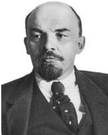
Lenin omkring den tid han var til kongres i København - og boede på Vesterbro

I virkelighedens verden stadfæstede socialdemokraterne her den politik, som gik ud på at holde arbejderklassen på den plads downstairs, der var tilmålt den af ‘herskabet’ upstairs — og først og fremmest at ‘holde ro på bagsmækken’.