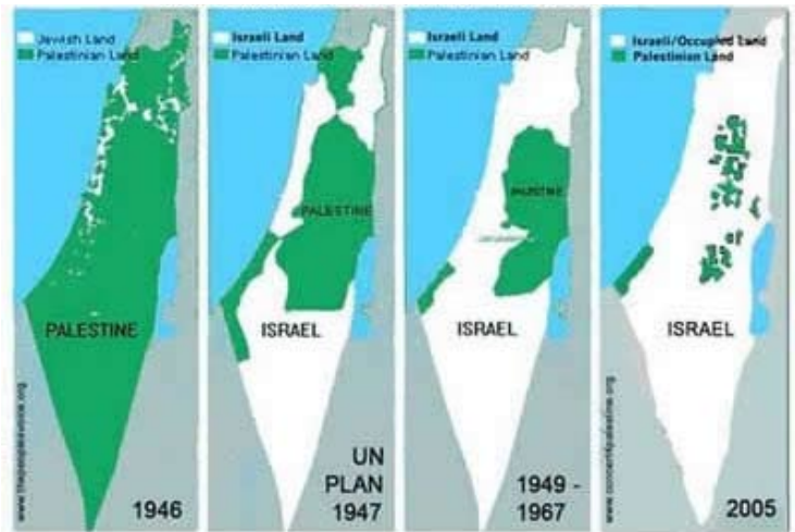
Palæstinensisk tab af land fra 1946-2005

EU – Danmark medregnet – svigter endnu engang palæstinenserne og dække over Israels forbrydelser.